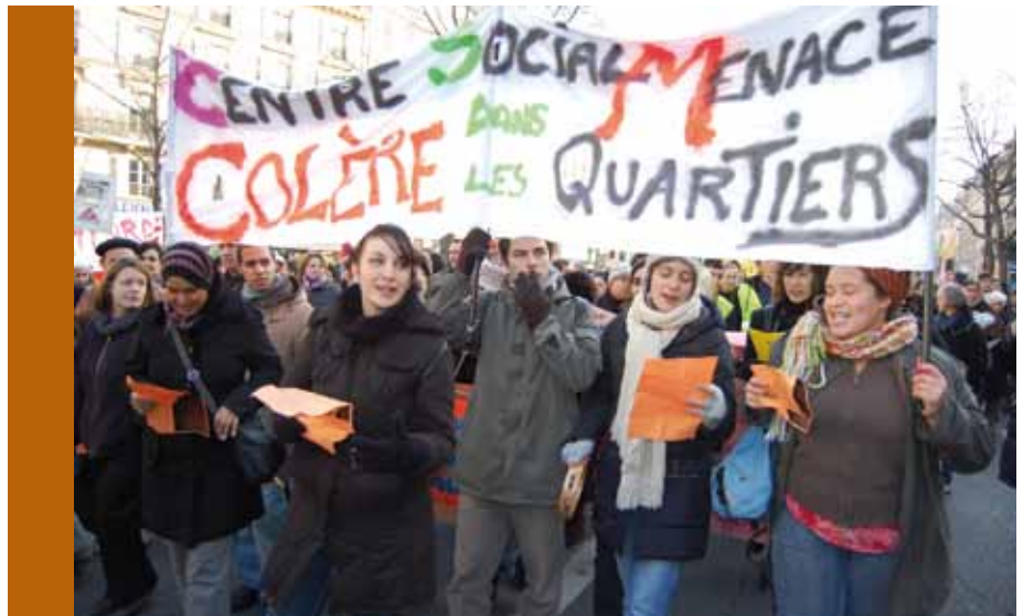
Mobilisation des centres sociaux parisiens, avril 2009

Tout cela dessine un avenir qui ne pense les associations qu'en gestionnaires de service public, répondant à une nécessité pour les pouvoirs publics de déléguer de manière plus efficace et souple (c'est-à-dire plus flexible et moins chère évidemment) une partie de leurs missions. Cela favorise les associations plus importantes et des mouvements de concentration, phénomène amplifié et accompagné par le développement des appels d'offre et marchés publics, dont la technicité ou le volume d'activité commandé écartent nombre d'acteurs. A contrario, on se demande quelle place les politiques accordent à la fonction citoyenne des associations, à un moment où la question du lien social devrait pourtant conduire à la valoriser.