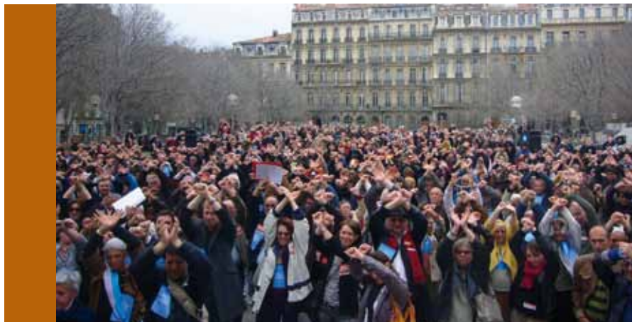
Rassemblement du 8 avril 2009 à Marseille, www.delinquants-solidaires.org

Professeur à l'Institute for Advanced Study de Princeton