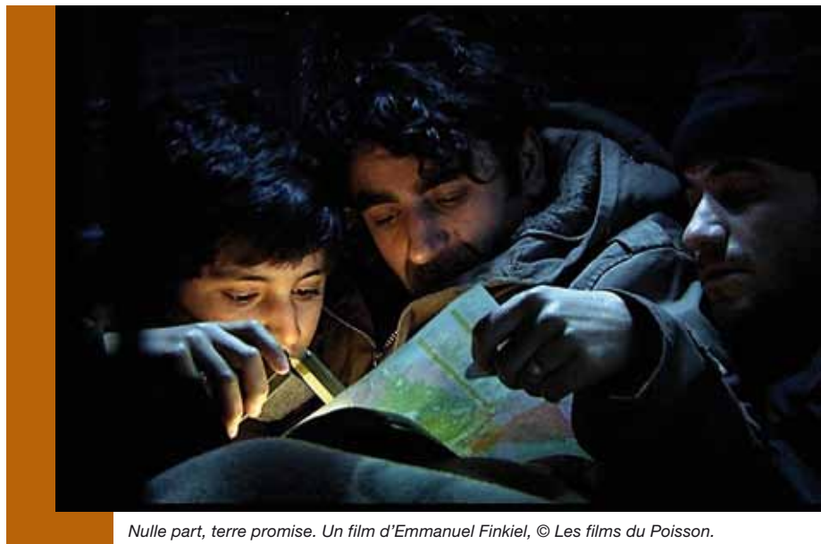
Nulle part, terre promise. Un film d'Emmanuel Finkiel, © Les films du Poisson.