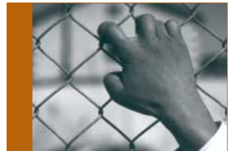
Cimade, Rapport 2008 sur la rétention administrative, www.cimade.org

- Enfin, elle fait obstacle au débat public sur les conditions d'enfermement des retenus. » Le 30 octobre 2008, dans le cadre d'un recours contentieux, le tribunal administratif de Paris annule le premier appel d'offres. Le ministère de l'Immigration récidive 2 mois plus tard : un nouvel appel d'offres est rendu public le 19 décembre, qui ne diffère qu'à la marge du précédent, sans remettre en cause le projet du gouvernement de faire de la rétention un marché offert au moins-disant, au mépris de la défense des droits des étrangers.