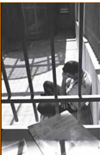
Cimade, Rapport 2008 sur la rétention administrative, www.cimade.org

L'anesthésie politique est ce qui caractérise les moments historiques comme celui que nous traversons. Des privations de droits, des restrictions de libertés, des menaces sur la prise de parole publique, un exercice tempéré de l'arbitraire peuvent ainsi se produire au quotidien sans que la société ne trouve les ressources pour s'y opposer. Si modeste qu'il soit dans ses effectifs et ses réalisations, le mouvement associatif et plus largement social qui se dessine est donc porteur d'une promesse – promesse que l'on ne renoncera pas au droit et à la solidarité, notamment lorsqu'ils concernent celles et ceux que le Comede appelle des exilés ■